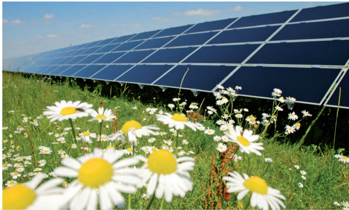
De opbrengst van het zonnepark gaat terug naar het eiland en zijn bewoners.

De Amelander Energie Coöperatie is opgericht in maart 2009. Nu zes jaar later hebben de ambitieuze plannen en doelgerichte projecten om te komen tot de ontwikkeling van duurzame energiebronnen op Ameland al menige energieschone vruchten afgeworpen. Maar er komen er nog meer. De AEC wil iedere Amelander en verblijvende recreant de mogelijkheid bieden om te participeren in het zonnepark van Ameland. Bij realisatie zal dit het grootste zonnepark van Nederland zijn. Inwoners van Ameland worden in de gelegenheid gesteld om één of meerdere zonnepanelen te adopteren. Dit door middel van een lening aan de AEC. Een lening voor een zonnepaneel van € 250,00. Met een rendement van ongeveer vier procent. Dit komt ook tegemoet aan de doelstelling bij de opzet van dit bijzondere zonnepark. Voor en door Ameland. De opbrengst, in brede betekenis, terug brengen naar het eiland en zijn bewoners.